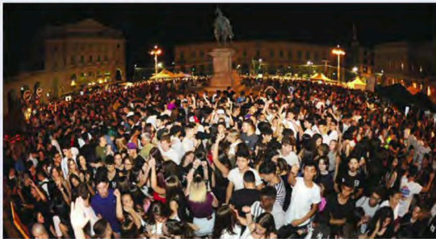
NOVARA La folla sabato sera in piazza Martiri